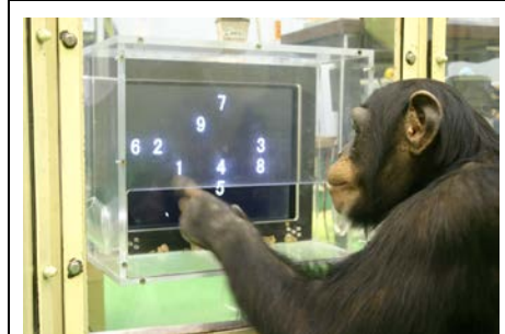
モニター画面の 1 から 9 までの数字を一瞬で記憶する子ども

・ 研究内容及び成果の概要 ：日本の実験研究とアフリカの野外研究を平行して進めた。霊長類研究所には 1 群 14 個体のチンパンジーがいて平成 12 年に誕生した 3 組の親子がいる。子どもたちが 4 歳から 8 歳に相当する時期だ。人間でいえば学童期（6 歳から 12 歳）にあたる。この時期に、チンパンジーの子どもたちは人間のおとなよりも優れた瞬間記憶のあることがわかった。画面の数字を一瞬見ただけでどの数字がどこにあるかわかる。そうした知性が自然の暮らしの中でどう活かされているか。ギニアのボソウの 1 群 13 個体を長期にわたって継続調査した。この子どもの時期に親やおとなが道具を使う様子をじっと見てまねるようになる。「教えない教育・見習う学習」という教育法のあることがわかった。