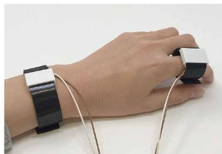
図2 振動提示装置(手首と指)

開発者が狙った触覚を自動生成するためのアルゴリズムを開発するとともに、その提示性能を評価した。様々な触覚フィードバックを検討した上で、特に多様な触覚フィードバックを使用者に提示することを目的として、ファントムセンセーションを用いた触覚フィード