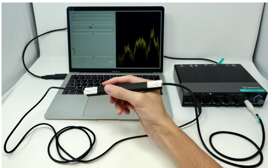
図4 クロスプラットフォーム版把持状態認識ソフトウェア

基本原理の応用可能性を探るために、アプリケーションの開発を継続的に行い、ノートパソコン用アプリケーションおよびスマートフォン用アプリケーションを開発した。