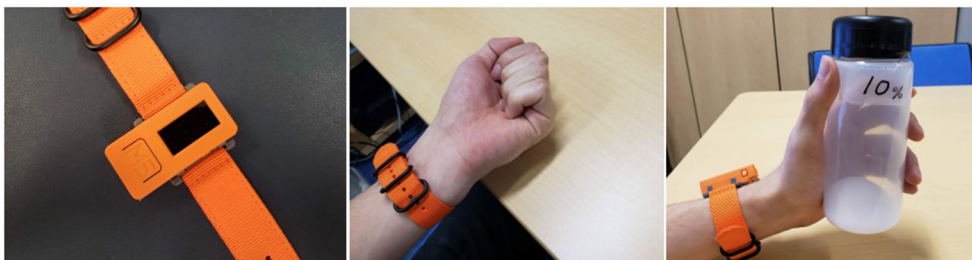
図3 能動的インタラクションに基づく状態認識

能動的に対象物に作用することにより対象物の状態の認識が行えることを明らかにした。すなわち、図3左に示される腕時計型デバイス（M5StickC）を装着した人が物に触れる際の音や手の動きをデバイスから取得することにより「接触した物の識別」（図3中）と「把持した物体の容量の認識」（図3右）が行える。デバイスからは、手周囲の音響信号、および加速度信号、角速度信号を取得し、これらのデータを機械学習に与えることによって認識を行う。