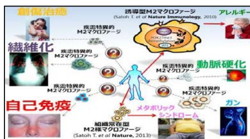
図2 疾患特異的 M2 マクロファージの分化