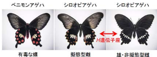
図1 シロオビアゲハのベイツ型擬態

supergene の概念は、100年近く前にナガサキアゲハのベイツ型擬態などで提唱された。その後 supergene が原因と見られる現象は多数報告されているが、分子の実体が明らかになったものはほとんどない 。シロオビアゲハのメスの一部（擬態型）は毒蝶に擬態するが、オスと非擬態型のメスはこれとは異なる紋様をしており、擬態型と非擬態型は1遺伝子座 H によって切替ることが知られていた（図1）。我々は、 全ゲノム解析などにより H 遺伝子座が性分化に関わる doublesex 遺伝子 ( dsx ) を含む 130kb に及ぶ領域からなり、擬態型 H と非擬態型 h の染色体では逆位によりその方向が逆転していることを見出した （図2）。この領域には、 dsx 以外に U3X と UXT という2種類の機能未知の遺伝子が含まれ、supergene として機能していることが示唆された。