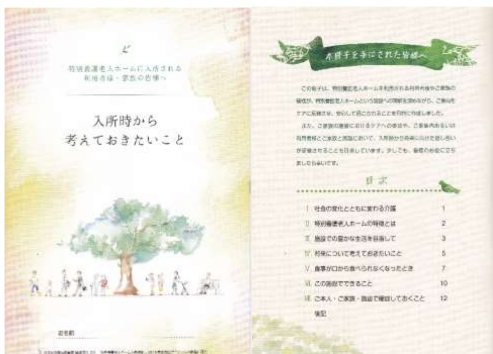
図2. ハンドブックの表紙および目次

COVID-19の問題もあり、完成後の早々の発送は叶わなかったが、今後、全国の施設に発送して、更なる修正を加えていくことにしている。改訂版については、PDFで大学成果物の掲載ページで公開し、自由にダウンロードできるようにすることにしている。また、研究2の詳細についても近く公開を予定している。