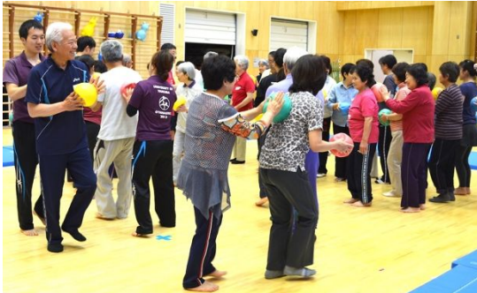
写真1 交流を重視した体操教室の様子

やっぱり楽しみにしてるっていうことは 潤いになってるしね。心の滋養って言うか やっぱり励みになってるし、一週間分の。