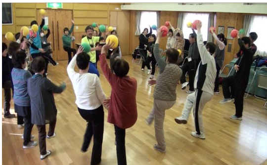
写真2 「シェー」ポーズでバランス課題

体操教室における活動中に自然発生した「笑い」の現象等を中心に、高齢者が運動プログラムを肯定的に捉えた場面について、その要因を分析した(写真2)。