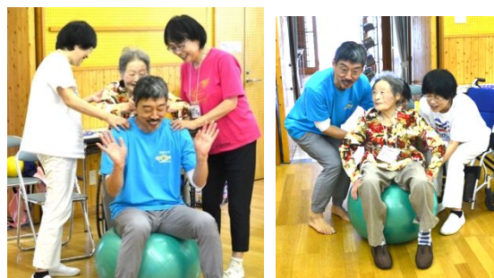
写真4 奉仕の態度 写真5 挑戦的態度

注2: 顔晴朗とは、体操を真面目に取り組むだけでなく、「できない」ことさえ、「笑い」の種にして楽しむように、顔を晴れやかに朗らかすること。