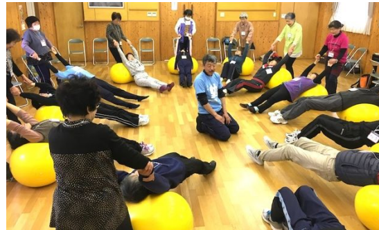
写真3 ピーナッツ型のGボールで体操

これらのことから、各種体操プログラムにおける運動課題は、その達成度を見るだけでなく、取り組んだ活動のプロセスにも意義を見出し、高齢者側に寄り添った観点から、高齢者の特性に応じて、各種体操用具(写真3)・世代に応じた音楽リズム・仲間との交流場面などを創意・工夫する重要性が示された。