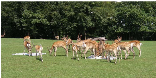
図 1. エゾシカに対するピラジン化合物の恐怖誘発性の検証実験の様子。ピラジン化合物を置いた餌場 (左) にはシカがあまり寄ってこなかった。

我々はオオカミの尿に含まれる 3 種類のアルキルピラジン化合物 (2,6-dimethylpyrazine, trimethylpyrazine, 3-ethyl-2,5-dimethylpyrazine) が恐怖反応誘発物質として作用することを見出した (Osada et al., 2013)。これらのピラジン化合物は、マウスやラットなどのげっ歯類だけでなく偶蹄類に属するエゾシカに対しても恐怖反応を引き起こす (図 1, Kashiwayanagi et al., 2017; Osada et al., 2014)。またピラジン化合物はマウスの 2 つの主な嗅覚器である主嗅覚器および鋤鼻器の両方で受容されて、その情報が脳内に伝達する (Osada et al., 2013)。