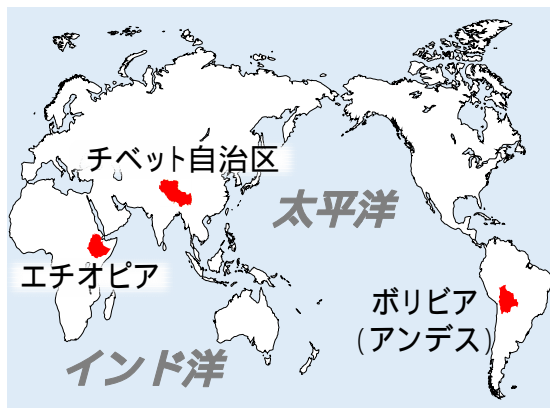
図 1. チベット自治区・ポリビア (アンデス高地集団)・エチオピアの地理的な位置

近年の研究により主にエチオピア・チベット・アンデス高地定住集団 (図 1) を対象に、高地という低圧低酸素条件に適応的な遺伝・生理要因の探索が進められてきた。チベット集団においては比較的研究が進んでいるが、まだ未解明な点が多い。特に高地に適応的な遺伝子多型が低地集団にどのような影響を及ぼすかはわかっていない。九州大学の研究グループが日本人男性 47 名 (平均年齢 23 歳) を対象に実施した低圧低酸素曝露実験の生理データ、およびそれらの被験者のゲノム DNA を保有しており、これらの使用が認められている。そこで本研究では、チベット集団の高地適応に関わる遺伝子多型が、日本人集団でどのような生理応答を示すかを調査することにした。