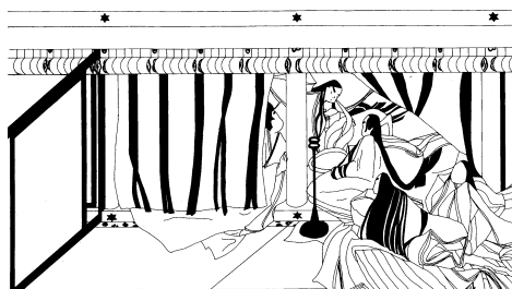
(図1)『源氏物語絵巻』横笛

寝殿造の列柱空間を利用して儀式や居住のための空間を作り出すのが寝殿造の建築文化である訳だが、正月大饗の時の寝殿母屋の宴会空間、移徙の際の寝殿母屋の室礼を除くと、宴会用の空間や居住用の空間は奥行き一間の細長い空間に設けられるという共通点がある。すなわち、任大臣大饗時には寝殿の南庇の奥行き一間の空間が宴会場の中心であったし、居住においても『源氏物語絵巻』横笛に見るように奥行き一間・横幅二間の空間が夕霧夫妻