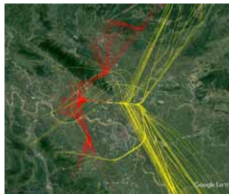
図1 航路データの例

ADS-B 信号を発信していない軍用機の機体について、空港周辺地域の騒音レベルへの影響が大きいことから、空港近傍において騒音実測調査および飛行している航空機の仰角測定を実施し、騒音推計に