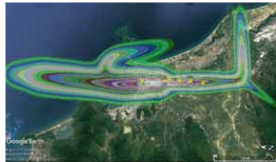
図 3 ダナン国際空港のノイズマップ

ノイズマップの推計精度を検証するため、上記 3 空港の周辺地域において、それぞれノイバイ国際空港で 13 軒、ダナン国際空港で 6 軒、タンソンニャット国際空港で 11 軒の民家の屋上等に騒音計を設置し、1 週間におよぶ騒音レベルの長期観測を実施した。得られた実測結果が時間帯別等価騒音レベル L_{den} を算出し、推計したノイズマップから得られた L_{den} と比較した。いずれの空港でも精度良く推計できていることが確認できたが、ノイバイ空港では測定期間中に東側戦闘機である Su-22 が飛行していたため、時間帯別等価騒音レベル L_{den} の実測値と推計値の誤差は 2.6dB (RMS Error) であった。この理由として、Integrated Noise Model には Su-22 のパワーレベルデータがないため、西側の類似機体 (F-16) のデータを用いたことがあげられる。そこで実測調査から得られた Su-22 の NPD データを用いることで実測値との誤差は 1.6dB となり、ノイズマップ推計手法の妥当性が確認された (図 4)。