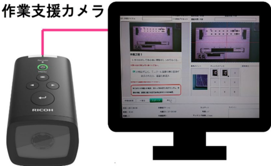
図1. インターンシップ・プログラムの実践例「画像認識による検査機の作成」

個別ニーズに応じた治具(治工具)の開発、支援ツールによる環境の改善他においては、オムロン京都太陽株式会社で設計・開発された治具を、特例子会社技術者、親会社技術者、学生と交えて様々な角度から議論し、分類を試みた。その結果、作業内容、機能、素材、動力源などの指標で分類して治具ライブラリを作り、その一部が会社HPで紹介された。治具の分類過程で、治具開発はライブラリの他、利用者の特性と作業内容のアセスメント能力が必須とわかった。