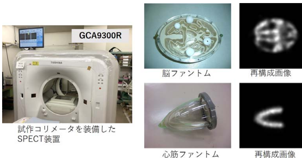
図4 試作したコリメータを用いた基礎実験