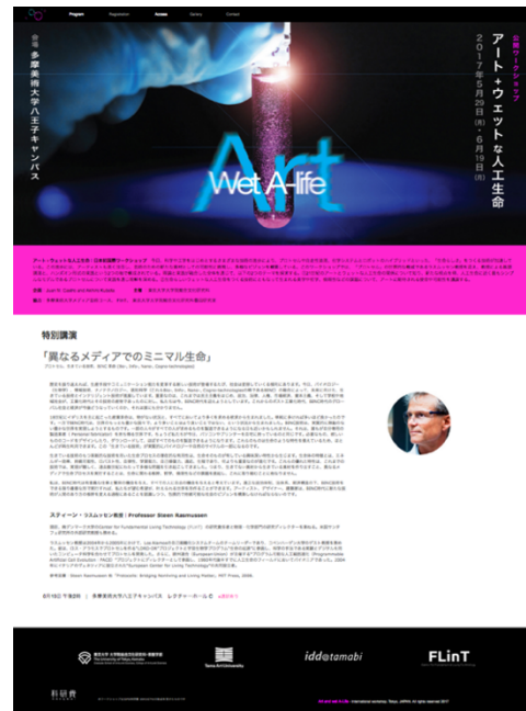
図4 「アート+ウェットな人工生命」日本初国際ワークショップのウェブサイト ( http://art-wetalife.com/ )

これらの研究成果を一般的に公開するために(特に芸術、デザインおよび生命科学の学生に)アートとウェットな人工生命のウェブサイト( http://art-wetalife.com/ )を構築した。このサイトでは、ワークショップに関する情報だけではなく、関連する研究分野についてのコンテンツ(多様なプロトセル・モデル、生命らしい技術とメディアアートに関する情報(写真、テキスト、ビデオ))も用いて構成した。