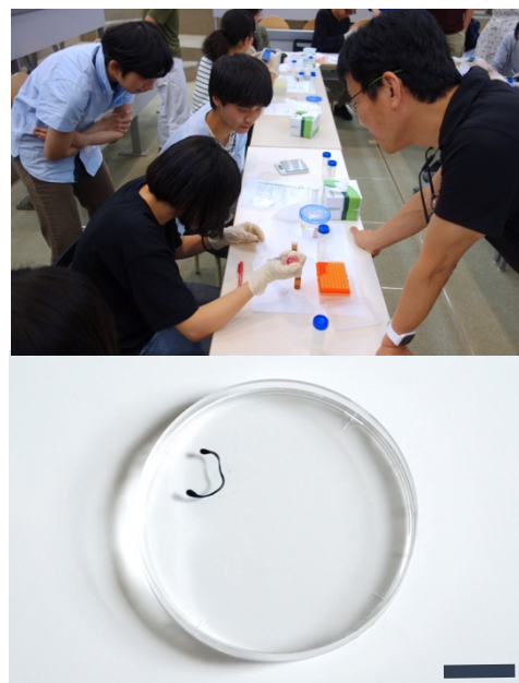
図2 「アート+ウエットな人工生命」日本初国際ワークショップ。ハンズオン形式「プロトセルを分裂させてみよう」の実践。Scale bar: 20mm.

プロトセルの世界的な権威であるスティーン・ラスムッセン教授（南デンマーク大学 Center for Fundamental Living Technology）を日本に迎え、基調講演を行い、ラスムッセン教授と久保田晃弘教授、筆者によるディスカッション、また参加者による質疑応答によるプログラム構成で開催した。ラスムッセン教授は、BINC時代（バイオテクノロジー、情報技術、ナノテクノロジー、認知科学の略であるBINC）と芸術、生命らしい技術の関係に関する基調講演を行った（図1）。