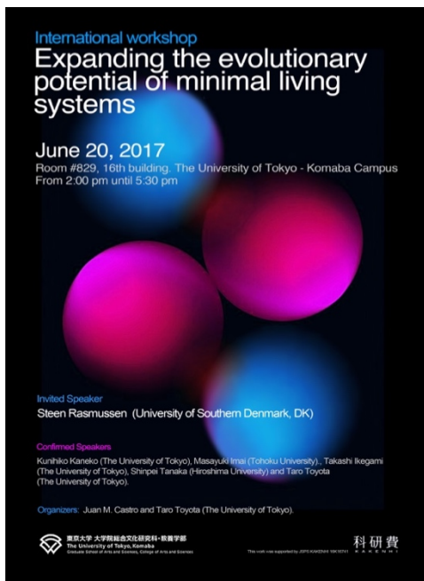
図3 国際ワークショップのチラシ “Expanding the evolutionary potential of minimal living systems”