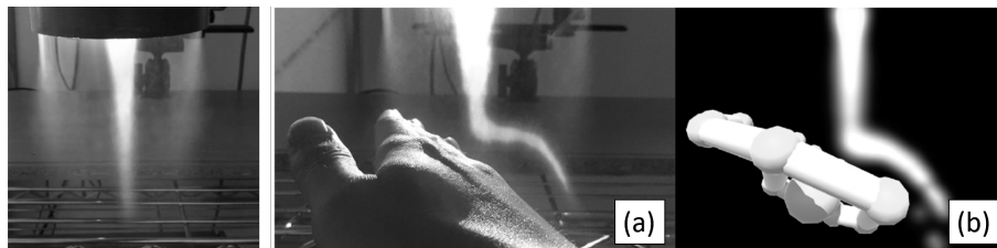
図1 「霧の流れを手で変える」動作に対する映像の変化の例.

上述の主要な研究内容である霧を媒体とするインタラクティブコンテンツと組み合わせることで、より新奇な体験を鑑賞者にもたらしため、水を媒体としたインタラクションのための技術開発を行った。具体的には、水を手で掬う動作をパターン認識技術によりリアルタイムで検出するシステムの開発と、Time of Flight(ToF)カメラを利用して水を撮像した際に生じる計測歪みを利用して容器内の水深を多点で同時に推定するシステムの開発を行った。動作のパターン認識および水深推定実験の結果ではともに良好な精度を得た。この結果を踏まえて、インタラクティブアート等に应用可能な、水を媒体として音・映像に変化をもたらすプロジェクターカメラシステムのプロトタイピングを行い、使用感について良好な評価結果を得た。