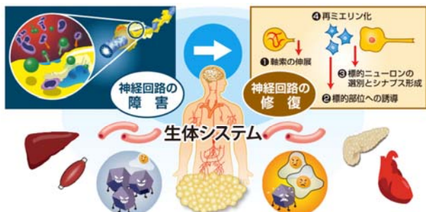
図1 本研究目的の概要

脳血管障害、脳・脊髄の外傷などの局所中枢神経障害、高次脳機能障害、神経障害性疼痛などの神経疾患においては、神経系のみならず免疫系、脈管系、様々な臓器からなる生体システムに時空間的变化をきたし、病態が形成される。本研究では、中枢神経回路の障害、その後の修復過程を、生体システムの機能ネットワークの観点から解析し、生体システムの時空間ダイナミクスによる一連の過程の制御機構の統合的解明に取り組む。特に、「神経系と各臓器」の連関による制御機構を見いだすことを本研究の到達目標とする(図1)。中枢神経回路障害と機能回復の過程を、生体システム全体のダイナミクスとして捉え、神経系と各システムの連関を統合的に解析することで、中枢神経回路障害における生体の動作原理を明らかにする。