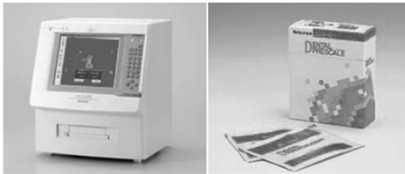
図1: デンタルプレスケール(GC社製)を用いた最大咬合力の測定

検診は岩手県花巻市大迫地区の一般住民を対象に毎年実施している。大迫地区は 4 地区に分かれており、検診は旧大迫町内 4 地区を年替わりに巡回して実施するため、4 年間隔での追跡調査が可能となる。検診項目は、口腔の指標として現在歯数、最大咬合力(図 1)、咀嚼能率(図 2)を測定し、フレイル指標としては身体的フレイルの指標として Body Mass Index(BMI)、精神的フレイルの指標として Mini Mental State Examination(MMSE)を用いた認知機能とした。その他の項目として、年齢、性別、喫煙、飲酒、既往歴、教育歴とした。これらを基に口腔保健指標とフレイル指標との関連を、統計学的手法を用いて検討を行った。