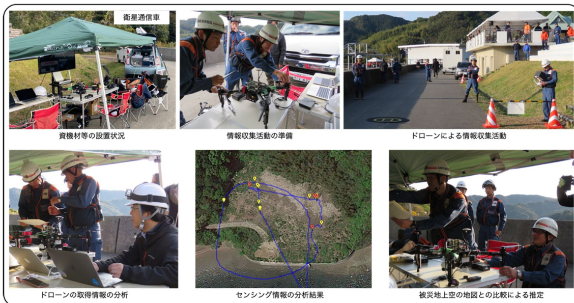
図 3：訓練時の様子とセンシング情報の分析結果

及び他の実務者からの本研究課題に対する意見等をもらうことであった。本訓練では、被災地域に対する空撮情報とセンシング情報を取得し、その後の活動に役立つ情報として指揮本部へ提供した。図 3 は実際の実証実験時の様子とセンシング情報の結果を示している。本実証実験では、建物や車内に置かれた7台のスマートフォン中5台のスマートフォンを上空から検知した。本実証実験より、スマートフォンの検知は消防活動においても、有用なツールの一つとなりうることを示した。