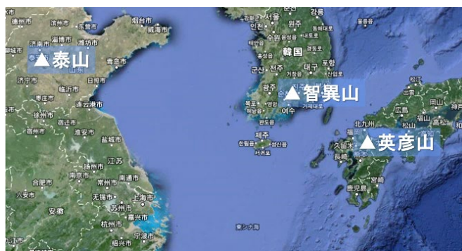
図1 英彦山・泰山・智異山の位置 (Google MAP を加工)

また、研究期間中には、(1)聖地観（自然と山岳宗教）、(2)宗教的实践（心意と山岳宗教）、(3)宗教制度（社会と山岳宗教）という3つのテーマを設け、各年度の重点調査事項に据えた。なお、本研究の遂行にあたっては、英彦山神宮・宗教法人神理教・添田町役場・泰山学院泰山研究院（中国）・国立慶尚大学校（韓国）・国立順天大学校（韓国）の協力と助言を得ることができた。