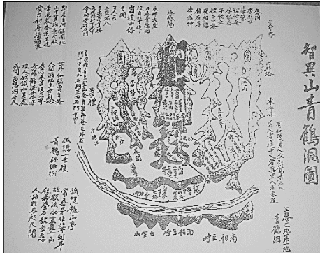
図5 智異山青鶴洞図（智異山・天帝宮）