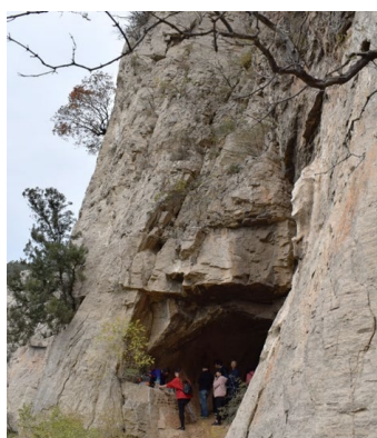
図3 玉皇洞(小泰山七十二洞のうち)

このように、山の自然と聖地観の一例を挙げてみたが、そこには多くの共通性が認められる一方で、差異も確認することができた。これには後述する宗教実践や宗教制度に依って生じた差異であると考えられる。