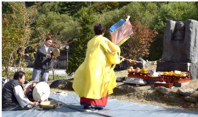
図4 ポサル(巫者)の祭祀(智異山天王ハルメ山神祭)