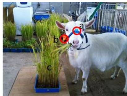
図1. 採食行動の記録の様子。a)超小型9軸DTロガー、b) ウェアラブルカメラ、c)マイクロ草地。

ヤギの採食行動はビデオカメラ (GZ-MG575-B, Victor Co. Ltd., 横浜) と既述のウェアラブルカメラによる映像によって記録した。ビデオカメラは、マイクロ草地の中心から 100 cm, 地面から高さ 39 cm の位置に三脚を用いて設置し、供試動物の採食行動を正面および側面から撮影した。カメラの画面内に採食行動の様子がおさまるようにズーム機能により画角を調節した。マ