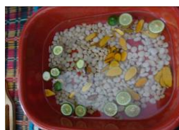
小石とハーブ（足浴用）