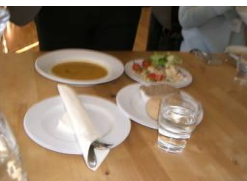
オーガニックフード