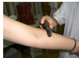
玄武岩（マッサージ）