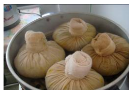
ハーブボール蒸し