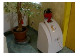
ホスピス外観（ドイツ） 酸素圧縮吸入器（ドイツ） <タイ国>