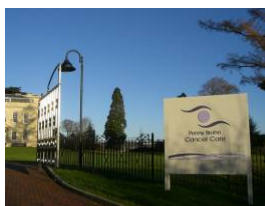
代替相補療法センター