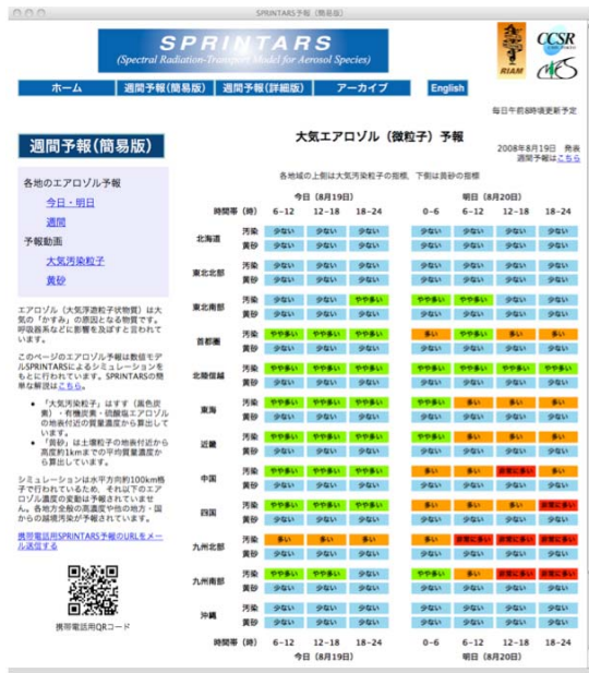
図 1 一般向けホームページのエアロゾル濃度予測の 4 段階表示の一例

予測結果を提供するホームページ ( http://sprintars.net/ ) には、一般向けの「簡易版」と専門家向けの「詳細版」とを準備している。簡易版の日本語ページでは、エアロゾルの種類を黒色炭素・有機炭素・硫酸塩エアロゾルの合計である「大気汚染粒子」と、土壌性エアロゾルである「黄砂」とに大別し、東アジア域の週間予測動画を掲載している他に、日本を 12 地域におおよそ分割して、当日と翌日は 6 時間毎、6 日後までは 1 日毎の大気汚染粒子および黄砂の濃度を、「少ない」「やや多い」「多い」「非常に多い」の 4 段階で表示している (図 1 参照)。動画と 4 段階表示は、モデル最下層から \sigma=0.9 (高度約 1km) までの平均質量濃度から作成している (図 2 参照)。なお、エアロゾルの高濃度の状態を注意喚起するという観点から、1 日毎の週間予測は、1 日平均値ではなく、6 時間平均値 (00-06JST, 06-12JST, 12-18JST, 18-24JST) のうち最大値を採用して表示している。また、携帯電話対応のサイトも構築しており、4 段階表示の情報を閲覧することができる。注意点として、水平分解能は約 1.1^\circ であるため、日本各地全般の高濃度および他の地方・国からの越境汚染はシミュレーションにより表現しているものの、分解能以下の現象 (例えば幹線道路沿いの高濃度エアロゾル等) は表現していないことを挙げておく。簡易版の英語ページでは、4 段階表示は行っ