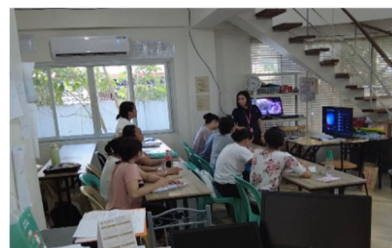
図3 日本語の授業の様子

終日行われる研修のうち午後の2時間で教室型の日本語学習が行われている。図3は日本語の授業の様子である。日本語母語話者であるインタビューーと同社の外国人家事支援人材として日本に5年間滞在し、フィリピンへの帰国後も引き続き同社に雇用されているフィリピン社員が教師となり、インタビューーが自作した日本語教材(紙媒体の教科書や音声教材等)を用いて授業を実施している。図4は自作教材である。業務で用いることが想定される単語(掃除、洗濯等に関わる語彙・表現)や定型表現(「お待たせいたしました」「ご準備させていただきます」「バスルームはどちらですか」等)の暗記とロールプレイ