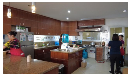
図2 キッチンでの研修の様子

現地での研修は約8週間である。渡日予定の外国人家事支援人材(20名~30名)が同施設に泊まり込み、共同生活をしながら研修を受ける。施設内は、日本の家屋をイメージさせる内装になっており(ただし、完全に再現することは難しく、一部は写真の掲示等で対応。)、キッチン、寝室、トイレ、シャワールーム、屋上などで業務上求められる日本での作法(お辞儀の仕方、屋内では靴を脱ぐ等)、家事支援業務に必要なさまざまなスキル(例：掃除「フロア、畳などは、目地に沿って拭く」「ホコリ取りをする」、洗濯物：「シワにならないようにする」「二つ折りにする」等)の習得を目的とした研修が行われている。図2は、キッチンでの研修の様子である。外国人家事支援人材受入れ開始直後は、体系立った研修は実施していなかったが、インタビューが赴任する数年前から研修内容の策定を試行錯誤しながらインタビューが行い、内容が固まってきたとのことである。