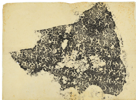
【図 2：立命館大学所蔵カラ=バルガスン

上掲【図 1】のように、画像としてはつなぎ目をほとんど確認できないほど、非常に鮮明に合成することができた。一連の画像をもって碑文テキストの分析作業をするために十分な画質を得たと判断できる。しかし、拓本の現状は必ずしも真っ平らの平面ではなく、長期間保存されていたためのシワが紙面に少なからず存在する。そうしたシワの部分の文字については紙の重なりによって採拓当初の状況を完全に復元できなかった点は想定外であった。また、拓本の経年劣化により判読し難い箇所も存在する。こうした視認性に難がある部分を検証するためには、複数の拓本画像を比較する必要がある。そのため今回、所蔵機関の異なる複数の拓本を画像化することが出来たことは有為であったと判断できる。