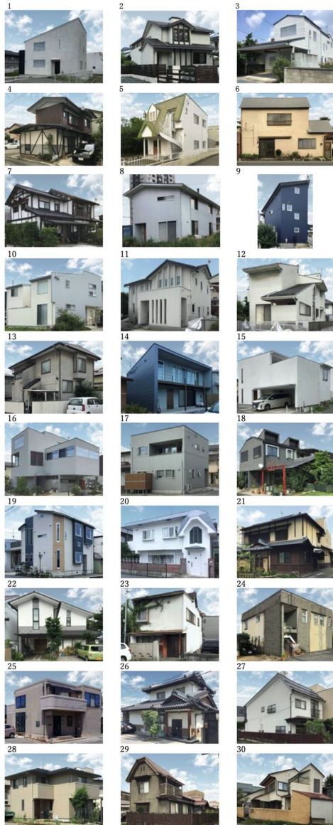
図4．開口部 20%に統制した事例