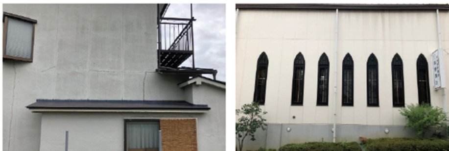
図 1 . 確認した劣化や汚れの一例

本研究の目的である「良質で継続性のある住宅」を実質化し、未来の住み手に対しても魅力的であり続けるために必要な空間構成要素を、以下の 5 つの調査と 6 つの実験——既存住宅の外観評価に影響する要素(1.劣化や汚れ、2.主に屋根形状と開口部の面積、3.外構および屋根形状と木質部の面積)に関わる 3 つの標本調査、それらの結果に基づいて戸建て住宅の外観(1.劣化や汚れ、2.開口部の面積、3.木質化率)を画像加工によって段階的に変化させた 3 つの実験室実験、実際の建物に劣化や汚れを再現して評価させた現場実験、日本とマレーシアの住宅(店舗も兼ねる)を対象とする実測調査と建物に関わる印象評価実験——を通して得られたデータを統計的に分析し、地域性や風土が建物の価値などに影響する要因について考察した。