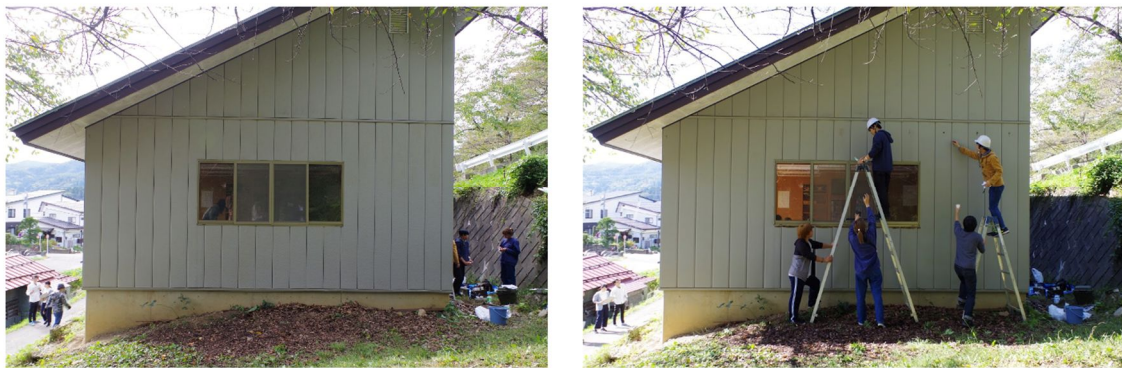
図 3 . 実験時の再現作業