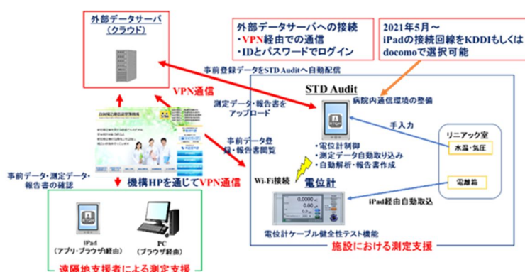
図2 出力線量測定遠隔支援システム (STD-Audit)

地域連携支援活動では、地域の支援者と遠隔地の支援者が共にデータ共有して支援を行う STD-Audit を開発し、PS の実施によって改良を重ねてきた。図2にシステムの概要図を示す。これは、地域支援者が施設に訪問する際に、事前に機材を送付して運用する。施設訪問者は、タブレット通信端末 (iPad) を利用して出力線量測定や写真撮影を行い、VPN 接続を通じてクラウドサーバに自動的にデータ送信するシステムである。サーバには、遠隔地の支援チームが PC やタブレットを利用して品質管理機構ホームページのから測定データや画像データなどを確認することができる。これによって、セキュリティの確保された環境で施設担当者、訪問支援者、遠隔地支援者が連携して、組織的にサポートを行うことが可能となった。支援終了後は自動的に報告書作成も行う。