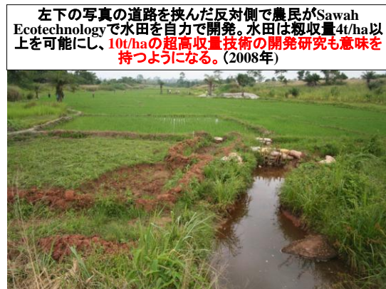
左下の写真の道路を挟んだ反対側で農民がSawah Ecotechnologyで水田を自力で開発。水田は籾収量4t/ha以上を可能にし、10t/haの超高収量技術の開発研究も意味を持つようになる。(2008年)

(2) アクションリサーチを実施した地域の低地の土地制度は大別して、①伝統的な首長の所有・村落社会の共有的所有権にある場合、②都市近郊で、すでに私的土地所有となっている場合、③共有と私的所有が共存する場合等がある。水田化により畔と水路の明確な区画ができるので、適地選定時に関係者による話し合いがないと摩擦が発生する。しかし、伝統的なヤブ状低地に比べ、水田化した低地の持続可能な生産性は極め高いので、増加した経済力により、水田開発を阻害しない調整は可能であった。