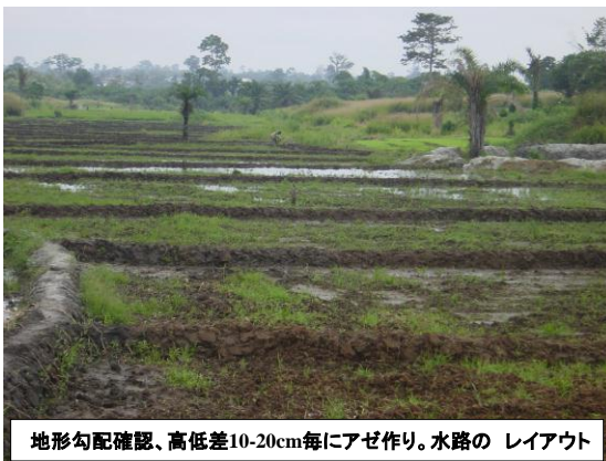
地形勾配確認、高低差10-20cm毎にアゼ作り。水路のレイアウト

水田仮説(1): 科学技術の適応には前提となる作動条件がある(福島原発が地震と津波でその技術の作動条件が破壊され制御不能になった場合と対比可能): 稲に限らず、トウモロコシ、ソルガム、キャッサバも同様。農地基盤が分類区画され整備される必要がある。どんなに良い品種でも、ヤブ状の栽培環境では能力を発揮できず、施肥も無駄になる。当然、土や水の保全管理もできない。