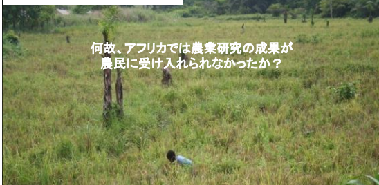
ヤブ状態のガーナの低地稲作地(2008年)