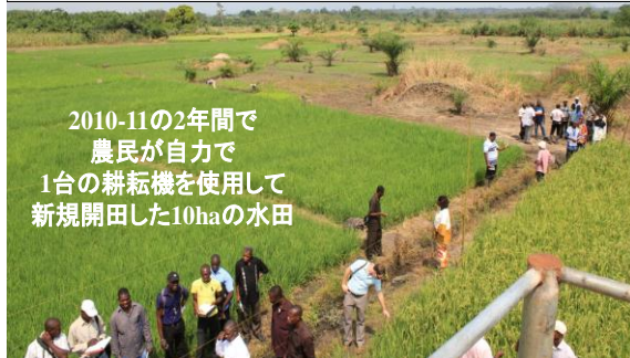
ナイジェリアサイトの適地適田開発と訓練の進行

2011年11月、ガーナ科学技術省(大臣が出席)と農業省、筑波の国際農研(JIRCAS)、Africa Rice Center、近畿大Sawah projectは農民の自力水田開発技術に関する最初の国際ワークショップをクマシ市で共催。ガーナ、ナイジェリア、トーゴ、ベナンから140名の技術者・普及員が参加。篤農(農民グループを含む)は2010-2011時点では、1-2年で5-10haを新規開田し、年間20-50トン以上の籾生産を達成できるように進化。