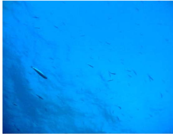
延縄カメラに出現したカタクチイワシ( )

シイラが生息する表層環境に設置したカメラに出現した生物はほとんどが魚類であったがこの結果はシイラの胃内容物研究結果と一致していた。延縄と漂流物では出現する種類が異なった。遊泳行動実験から、シイラが漂流物のある水面に出現するのは夜間で余り活発に行動しないことが示唆されている。このことから、漂流物に出現した魚類はシイラの主要な餌ではなく、この実験海域ではカタクチイワシが主要な餌であると考えられた。採餌時間は昼間、水深は20-20mで、浮上遊泳し、餌を探索しつつ採餌していると推察された。