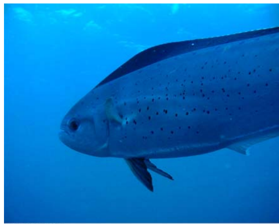
流物カメラに出現したシイラ