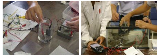
(b) 電気化学基礎実験