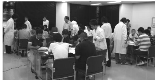
図 4 実施した実験講座の様子

図3で示した実験内容を、設備管理技術者(民間企業)向け出張講座2講座を実施した。また、内容の一部を既存の同大学主催の2講座に対して実施した。図4に実施した実験講座の様子を示す。各班に実験を指導し、受講者の理解を手助けするティーチングアシスタント(TA)を配置した。TAには、事前に実験内容を十分理解させ、初学者が疑問に思う質問事項等を整理させ、質問に対応できるよう訓練を行った。