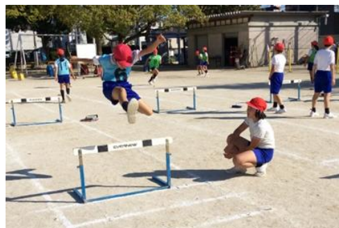
図1 役割を分担して課題解決を目指す

単元始めに課題分析を行った。ワークシートの自分の運動の様子を写した写真と、動きのお手本とを