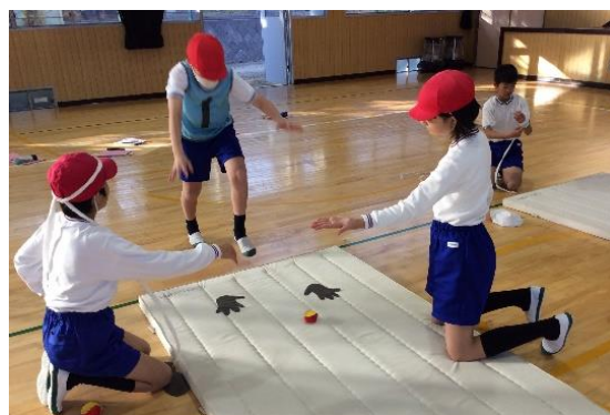
図2 課題に合わせて練習方法を選択

学習のまとめとして、単元のはじめの動きと最後の発表の出来栄を比較した。動画を確認することで、はじめと比べて良くなったところや改善が見られる点を伝え合えるようにした。【授業改善のポイント③】また、振り返りをOPPシートに記述させることで、自分自身の気づきとチームでのかかわりについての気づきを蓄積し、ふり返れるようにした。