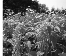
写真 2 ブハラにおける好塩性植物 ( Amaranth sp. ) の優先地