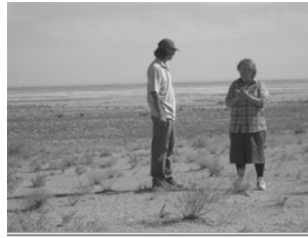
写真 1 ブハラの塩害地域調査 (北九州市大, ICARDA)

しかしながら、塩害土壌を低コストで修復し、通常の作物生産に移行できるようにするには、農業の一環としてこのような植物の積極的栽培から一定の経済便益が得られる技術システム・社会システムの導入が不可欠である。このことを考慮して、土壌修復のシナリオを示したものが図 2 である。いかなる植物も生えない塩害砂漠に陥っている地域は土壌