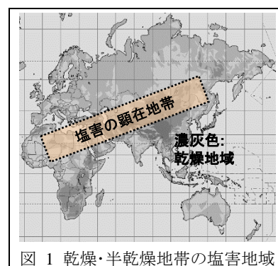
図 1 乾燥・半乾燥地帯の塩害地域

アジア・アフリカの乾燥・半乾燥地帯では内陸地の塩害が深刻化しており、例えば、ウズベキスタンではほぼ全ての農地が塩害に直面して農地の放棄や著しい生産減少に陥っている。人々の生活レベルの向上や人口増によって農産物の消費が急上昇している現在では、農地の確保は決定的に重要であるものの、塩害の拡大がこれを妨げている。また、アラル海のように塩害によって生態系が完全に破壊された事例もある。塩害を受けた土壌を修復する確実な方法は土壌中の塩類を表流水で物理的に洗い流すことであるが、内陸地ではその水自体が不足している上に、塩類が溶解した水は再び河川に入るため下流で再び塩の二次汚染を招いてしまう。これを解決するには洗浄以外の方法で土壌から塩を抽出・分離し、別の場所に固形物として隔離するしか方法がない。