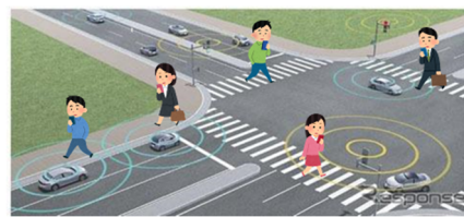
図1 無線LANを用いた車載APの広域被覆配置による広域高速大容量通信

まず、本研究の学術的背景について述べる。ミッションクリティカルな通信サービスは、自動運転や仮想現実(VR)における必須機能として、必要性がますます増大している。第五世代移動通信(5G)では、「高速あるいは大量収容」のどちらか一方しか提供できない。しかし、IoTの発展により、ドローンに代表される移動型監視カメラや高精細の固定型監視カメラあるいはVRヘッドセットなどがネットワークにつながる時代には、「高速かつ大量収容」を実現するネットワークが必要になる。一方、WiFi