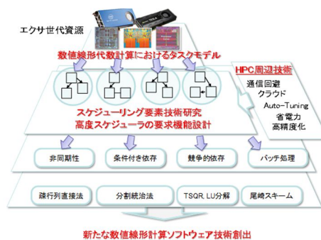
図1. 本研究における研究展開

このような状況のもと、数値線形計算ソフトウェアの開発のみならず利便性の向上と多様なメニコア計算環境での高性能化のため、研究グループがこれまでに培ってきた応用数学技術とHPC技術を連動させ、数値線形代数研究者の視点からエクサ時代に必須となるタスクスケジューリングの技術要件を提案する。図1に示す技術展開構想の下、個々の研究者が実施する既存数値線形代数ソルバにこれら技術要件を適用することを本研究提案での達成目標とする。最終的にはその成果を元に、将来の高性能高次元数値線形代数計算ソフトウェア実現に向けた新しい技術創出を目的とする。