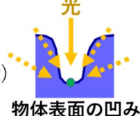
図2: 照明計算の定式化の違い。