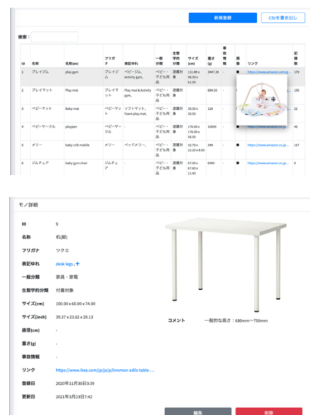
図1. データベース 検索(上)・入力(下)画面

乳幼児の撮影時に加速度センサー(3軸)、地磁気センサー(3軸)、温度センサー、湿度センサー、気圧センサー、照度センサーの6種のセンサーにより、乳幼児の周囲環境の情報の取得を試みた。1年目年の秋から始めた新規の縦断的観察では、センサーの接続が