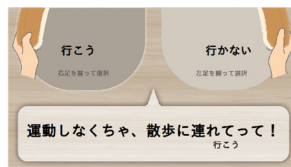
(a) ロボットとの会話画面