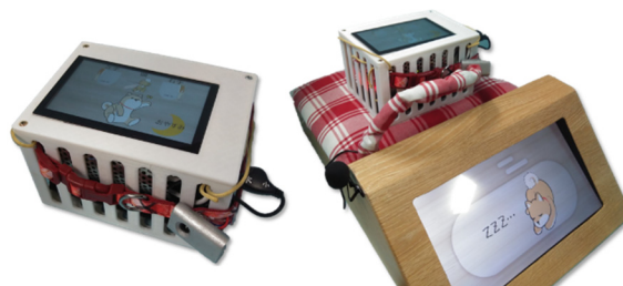
図 3. 箱形筐体の子機 (2D 版子機)

開発したロボットを用いて、被験者 3 名 (A: 86 歳男性, B: 79 歳男性, C: 85 歳女性) を対象とした約 2 週間の介入実験を行った。なお本研究の実験内容は茨城大学生命倫理委員会より承認を得た (承認日 2021 年 1 月 18 日, 許可番号 20T0900)。ロボットの外観の違いによる比較を行うため、子機ロボットの内部システムを移植した箱形筐体の子機 (図 3 参照, 以下 2D 版子機, 犬型の筐体を 3D 版子機と呼称) を作成し、各 1 週間ずつ被験者の自宅に設置した。なお、設置する子機の順番は被験者ごとに入れ替えている。ロボットの設置期間中および前後 3 日間には歩数計による歩数記録, 設置期間中は SD 法に基づく印象調査を行った。また、各子機の設置終了日には、ロボットの最終的な印象と機能の必要性について SD 法に基づくアンケートを用いて聴取調査を実施した。