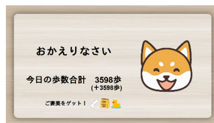
(b) 散歩結果表示画面