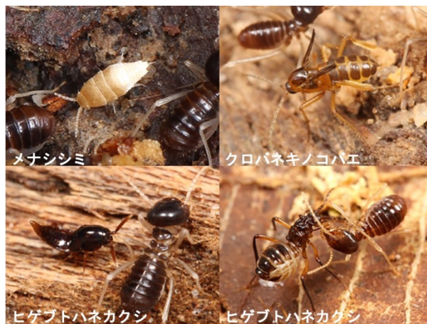
図1 アシナガシロアリを寄主とする好白蟻性昆虫。

シロアリの巣に見られる生物多様性は、どのように創出されたのだろうか。同種の寄主をもつ複数の好白蟻性昆虫は、寄主との共進化という進化史を共有しているため、現在の種や形態の多様性は各系統の特性を反映していると予想される。これを明らかにするためには、同種のシロアリを寄主とする複数の好白蟻性昆虫について、種や形態の多様化の歴史を詳細に推定し比較すると共に、その種多様性の実態を詳細に解明する必要がある。