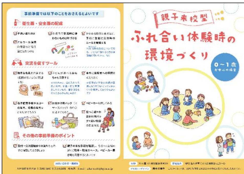
リーフレット (表紙・裏表紙)

(1) の家庭科教員への調査結果に加え、子育て支援施設のスタッフおよび利用者である乳幼児の保護者へのインタビュー調査の結果をふまえ、ふれ合い体験を企画する立場である家庭科教員を対象としたリーフレット『親子来校型 ふれ合い体験時の環境づくり (0～1歳が中心の場合)』を作成した。リーフレットは、現職の家庭科教員へ配布した。また、PDF版を日本家庭科教育学会ホームページ内 ( https://www.jahee.jp/ ) 「家庭科学習支援サイト」にて公開した。PDF版は誰でも無料でダウンロードが可能である。