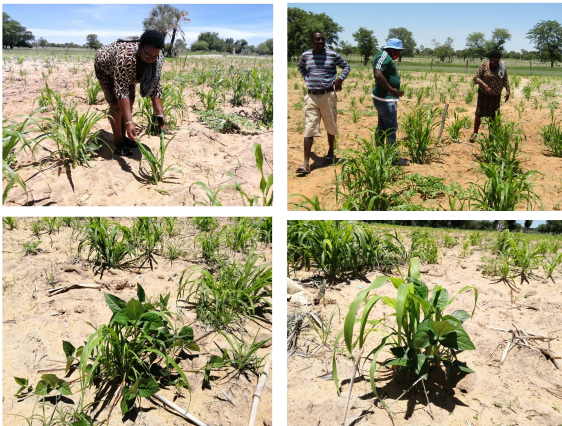
第3図 左上 実証試験に参画した農家が、接触混植したパールミレットとソルガムを示した。 右上 農家圃場にて接触混植個体群を視察する共同研究者(中央)と農家(左と右) 左下 パールミレットとカウピーの接触混植。両種とも複数個体を残して株状栽培。 右下 同上。両種とも間引きし、単独個体同土とした株。農家が創意工夫し、実証中。

せている。そこで、ナミビア大学オゴンゴ校内の附属農場施設内で、パールミレットとソルガムの接触混植試験を行った。2020/2021年作付け期の成果としては、土地等価比率(混作の収量性)が十分に高い成果が得られたため、2021/2022年作付け期も継続して圃場試験を行った。農家圃場においても栽培を希望する農家に種子を提供し、2020/2021年作付け期から実証試験を開始した。これまで接触混植を試行した経験を持たない農家も多数、実証試験に参画した。ナミビア北部2州(OmusatiとOshana)では、2020/2021までに25軒の農家が研究に参画してきた。Ohangwena州では、これまで接触混植を試行した経験を持たない農家も試験に参画し、2021/2022と2022/2023年には21軒の新規農家の参入が認められた。研究期間内に、北部4州において、46軒の農家において実証試験を行った。本農法の拡大が期待できよう(第3図参照)。