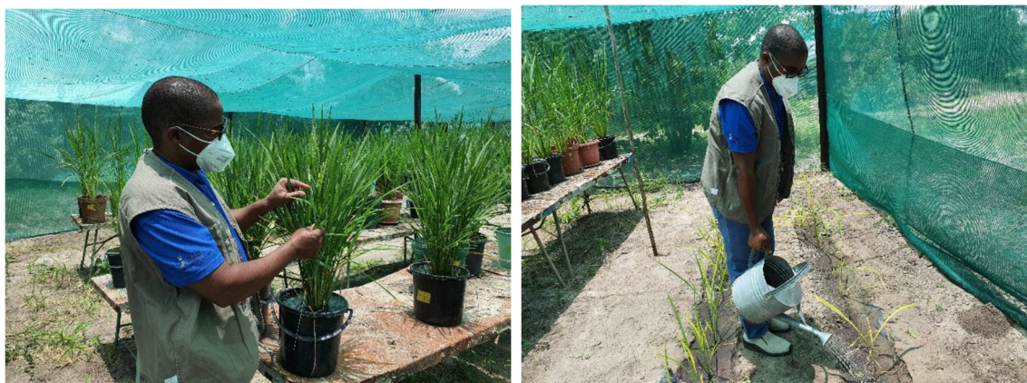
第 4 図 左 導入したイネ品種の出穂状況を調査する共同研究者 右 網室内に作成した「モデル圃場」にて、イネに水やりする共同研究者

隣国のボツワナはナミビアと同様な自然・社会環境を持つため、南部アフリカにおける拠点形成を目的としてボツワナ大学とも共同研究を開始した。ボツワナでは現在、稲作は行われておらず、イネの遺伝資源も皆無であった。そこで、2002 年から開始した一連の先行研究 (科研 B、科研 A、SATREPS 等) によりナミビアに導入した 100 数十系統のイネ品種群の中から、栽培のし易さと、収量性、ストレス耐性などを考慮して、十数品種を選んだ。それらをナミビア大学からボツワナ大学に植物検疫手続きを経て送付した。次に、それらのイネ品種群の種子増殖を開始した。潜在的な稲作圃場を、農水省研究部、ボツワナ大学研究者とともに視察し、将来的な共同研究戦略を打ち合わせた。イネ品種群の栽培試験を 2019/2020 作付け期に開始し、2022/2023 まで 4 か年に渡って、種々の栽培トライアルを継続中である。2021/2022 からは「モデル圃場」への作付けを開始し、種子の更新と栽培試験を拡大した。2022/2023 には接触混植試験も開始した。今後の普及を視野に入れ、カウピーとイネとの接触混植栽培を実施し、基礎データを取得した。