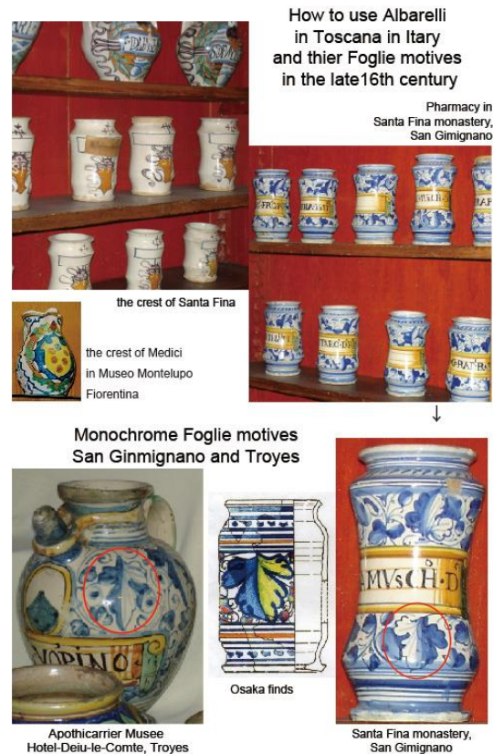
図5 サンタフィーナ修道院とオテルデュー修道院薬局のアルバレルロ

イタリア・トスカーナのサンタフィーナ修道院やフランス・トロワのオテルデュー修道院の薬局のように、アルバレルロは同一規格品が各種薬の保管壺として薬局や病院の棚にズラリと並ぶ (図 5)。