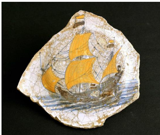
図 6 Neude 出土の皿

だが、ユトレヒトではオランダ連合東インド会社 V.O.C. と結びつく 17 世紀の破片の出土がある。V.O.C. 外洋帆船を描く皿である(図 6)。