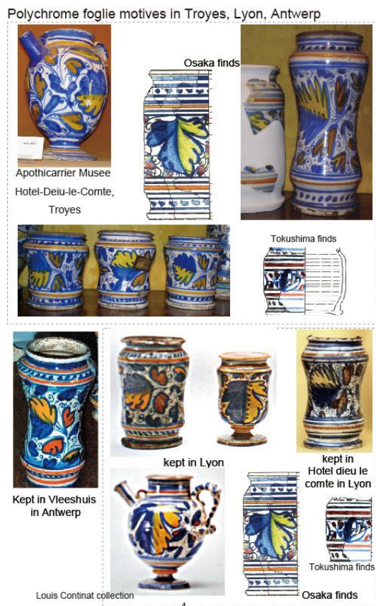
図2 リヨン、アントワープのマジョリカ

文は、16世紀後半のリヨンとアントワープに見られる(図2)。だが、これらは日本のものほど写実的ではなく、むしろ後出のデフォルメしたもののようにみえる。写実的な葉の表現は青単色のマジョリカにあり、これらは17世紀代にも引き続き各地で製作される。