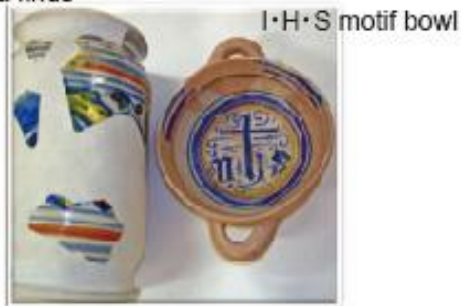
図4 IHS モチーフ両耳碗と大坂出土品

イタリア・トスカーナのサンタフィーナ修道院やフランス・トロワのオテルデュー修道院の薬局のように、アルバレルロは同一規格品が各種薬の保管壺として薬局や病院の棚にズラリと並ぶ (図 5)。