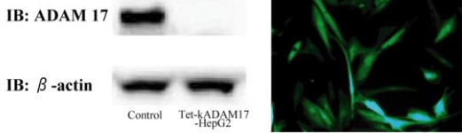
Tet-kADAM17-HepG2におけるADAM17タンパクの抑制(左)とEmGFPの発光(右)

ADAM17に加えて、3つのADAM familyについて(ADAM9, 10, 12) vectorを作製し、2種類の細胞(HepG2, LI-90)のinducible knock-down cloneを作製する。各々のinducible knock-down cloneについて、ADAMのmRNA/proteinでの発現レベルの定量は勿論のこと、「がん-間質相互作用」を担うと推測されるTNF \alpha 、ADAMによってプロセシングされ細胞の増殖に影響を与えると推測される、HB-EGF、TNF \alpha 、amphiregulin, epiregulinの発現レベルを定量PCRおよびwestern blotで解析する。また、これらの分子については培養上清中の濃度もELISAで測定する。