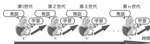
図1：繰り返し学習モデル

言語の通時的変化モデル：Kirbyによる繰り返し学習モデル(Iterated Learning Model) (Kirby, 2001)をベースとして用いる。これは図1に示すように、基本的な子供の言語発達の能力を仮定し、何世代にもわたる繰り返し学習を行うというモデルである。