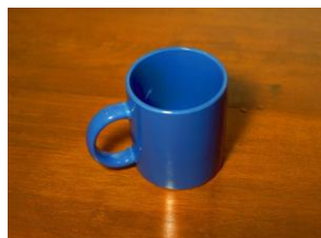
図 2 Lang et al. (1999)による感情誘導刺激の例 (上がネガティブ画像, 下がニュートラル画像)

【手続き】実験は、3~6名の小集団形式とし、感情誘導セッション、学習セッション、言語化セッション、テストセッションの4つのセッションから構成された。まず、感情誘導セッションでは、ネガティブ群の参加者はネガティブ画像10枚とニュートラル画像3枚が、ニュートラル群の参加者はニュートラル画像13枚がランダムに提示され、画像ごとに好ましさを評定する方向づけ課題を行った。なお、画像の提示の前後に、Affect Gridを用いて、感情状態の評定を行った。次に、学習セッションでは、すべての参加者が、テスト予告を行う意図学習教示のもと、5秒間で顔を記憶し、続いて5分間のフィラー課題を行った。そして、言語化セッションでは、言語化あり群に割り当てられた参加者は、5分間で、顔を言語描写し、言語化なし群の参加者は、5分間、クロスワード課題を行う。最後に、テストセッションとして、ターゲット1枚、ディストラクター8枚を同時に提示し、多肢強制選択式の再認テストを行った。さらに、Affect Gridを用いて、感情状態の評定を行った。なお、ターゲットおよびディストラクターの提示位置はカウンターバランスを行った。