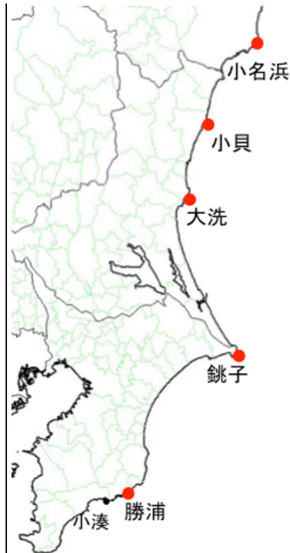
図1. 北関東沿岸におけるサンプリング地点（赤丸）

遺伝的解析のマーカは、ミトコンドリアハプロタイプについては、cox3 遺伝子および tRNA 遺伝子領域を用いた。tRNA 遺伝子群のスペーサーに存在する20塩基の挿入/欠失を電気泳動で判別することで大部分のサンプルのハプロタイプを決定した。また、一部の個体については、cox3 遺伝子および tRNA 遺伝子領域（合計908塩基対）の塩基配列を決定も行った。核コードのマーカとしては、すでに発表されているマイクロサテライトマーカ4座位（Daguin et al. 2005. Cons.