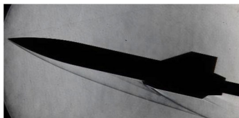
図 1. 実験機風洞実験 (Mach 5)

ロバスト性を持つ複合領域最適化研究の成果として、極超音速 FTB の解析環境を構築した。また、空力加熱を含めた熱構造 CFD コードを開発し、実験データと比較して、解析の妥当性を得た。ラム燃焼器の研究としては、燃焼器内圧力および火炎中の水蒸気から放出される近赤外発光計測結果に基づき、噴射器後流における保炎挙動の観察と種々の機械学習手法を用いた燃焼不安定性に着目した解析を実施した。当量比条件により、渦振動モードから熱音響振動モードへの遷移が起こることなどを捉えた。