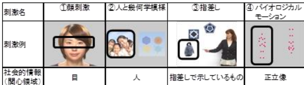
図2. Gazefinder®での動画刺激(黒枠で囲った部分が社会的情報)

目領域の注視を測定するために、視線追跡装置 Gazefinder® (JVCKENWOOD, 横浜)を使用した。Gazefinder®は対象者に2分間の動画を眺めてもらい、社会的情報をどれだけ見ていたかを「社会的情報への注目率(社会的情報を見ていた時間/刺激提示時間)」として客観的に算出できる機器である。Gazefinder®は、①顔刺激(口の動き無し)、②顔刺激(口の動き有り)、③バイオロジカル・モーション、④人と幾何学模様、⑤指差しの動画が計2分程度提示され、各刺激のArea of Interest (AoI; 顔刺激においては目領域)の注視率が算出される。Gazefinder®で提示される動画刺激と計測される社会的情報の領域(Area of interest; AOI)は図2の通りである。