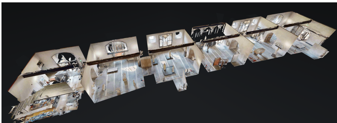
図1 彫刻ギャラリー全体の3Dモデル

ることが分かる。あたかも彫塑群が視線によって個人的な会話をしているような動的な関係性により、追従性を生み出す視線の運動を生み出しているのである。本研究では、これまでの既往の定性的な指摘事項を参照としながら、より具体的な視覚的表現を以って、空間的特徴を指摘することができた。