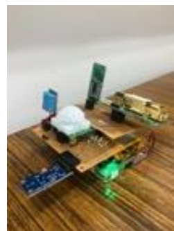
図2. 人感センサを搭載したデバイス

(1)の手法について、実際の人感センサを用いた有効性検証を行った。具体的には、人感センサを搭載したRaspberry Piで構築したデバイス（図2）を、配備した環境で、予め位置などを決めた直線上の経路を移動することで人感センサデータを取得し、推定された経路と、予め設定した直線経路と比較した[文献④]。その結果、以下のことが明らかになった。まず、この研究では(1)の手法を利用しているため、すべてのセンサには個体差はなく、センサの影響範囲も同じとしていたため、推定される移動経路が同じ方向にずれていく、という問題が報告された。また、誤差は影響範囲の個体差だけでなく、人の移動速度にも依存し、移動速度が速い場合にセンサ出力値が変わる際の解候補の存在する範囲も大きくなるため、推定精度が低下することが明らかとなった。移動速度は、データ取得のラグにも関係し、センサ影響範囲に実際に入った際に検出したセンサデータとして認識されてデータとして保存するまでに数秒のタイムラグがあることから、提案手法を用いてリアルタイムで推定を行う場合に大きな障壁となることが明らかとなった。