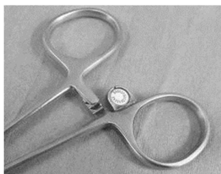
図1 RFID タグ付き手術器械

具体的には、図1に示すような Radiofrequency Identification (RFID) タグを用いて手術器械の使用状況をリアルタイムに取得する。