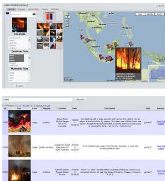
図3 インドネシア EEPIS との共同研究による 森林火災に関する知識ベースシステム

ため、研究代表者は2009年度～2012年度の 研究期間中、23 件の雑誌論文(査読有)の発表、 59件の学会発表[16件の国際学会・ワークショップ 招待講演・42 件の国際学会発表(査読有)・1 件の国内学会発表(査読有)]を行った。