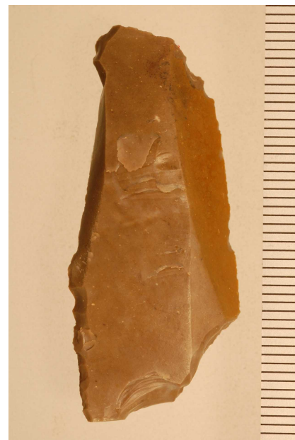
図2 2009年出土のナイフ形石器

おいて多数とらえることに成功した（図3）ことがあげられる。このように、石器と動物骨が比較的まとまった範囲に確認できたことによって、出土動物へのヒトの関与の可能性がより高いものとなった。さらには、第3段階における偶蹄類の歯、ムササビに類するリス科の歯の存在を加えると、本遺跡における旧石器時代の人類活動の証拠がより多様で明確な形で得られた例として、日本列島における旧石器時代調査の中で初めての成果といえる。