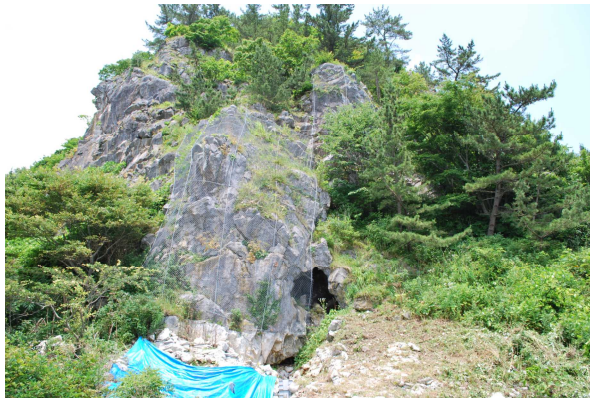
図1 尻芳安部洞窟（安部遺跡）

この第3段階の層準からは、大型偶蹄類の歯、焼骨、ウサギの骨なども発見されていたため、この遺跡における、旧石器時代、すなわち地質学での区分では後期更新世に属する人類活動の痕跡は確実なものとなった。