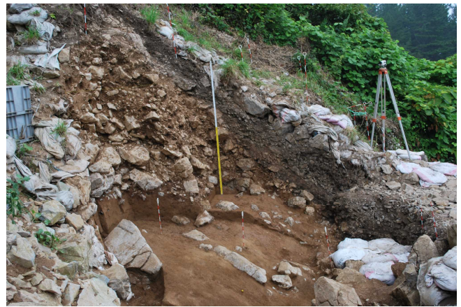
図5 尻労安部洞窟の第3段階の層